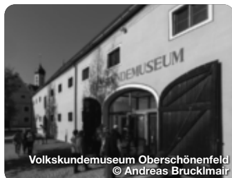
Volkskundemuseum Oberschönenfeld