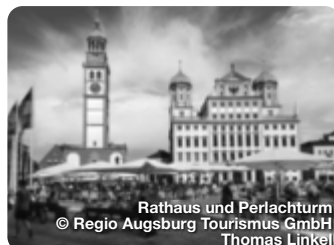
Rathaus und Perlachturm