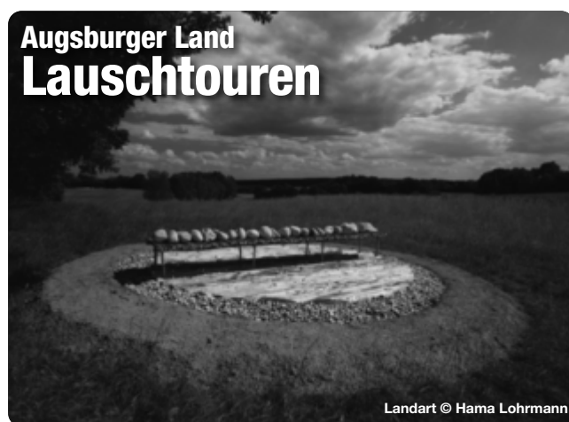
Landart © Hama Lohrmann

Mit dem Audioguide auf den Spuren großer Persönlichkeiten wandern und dabei spannende Erlebnisse und unterhaltsame Geschichten hören. Alles was Sie dafür benötigen ist die kostenlose Bayerisch-Schwaben-Lauschtour App. Mit dem GPS werden die Lauschpunkte automatisch abgespielt – gehen Sie die Tour also in Ihrem eigenen Tempo. Unser Tipp: Die Touren funktionieren auch offline. Am besten lädt man die Tour bereits zu Hause im WLAN herunter.