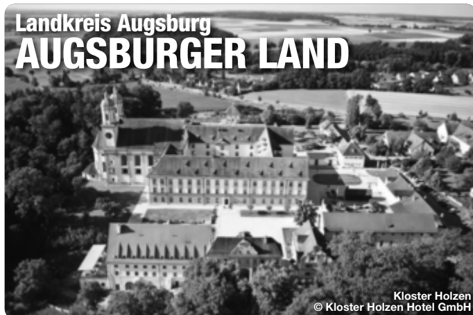
Kloster Holzen

Das Augsburger Land. Mit seiner reichen Geschichte, seiner vielfältigen Kultur und Landschaft ist das Augsburger Land ein attraktives Ziel für ein paar Tage Entspannung. Der Naturpark Augsburg - Westliche Wälder ist die grüne Lunge und lädt zum Naturerlebnis und zur Entschleunigung ein. Die Flüsse Lech und Wertach prägen die Landschaft und bieten zahlreiche Möglichkeiten zum Wandern und Radfahren. Ein vielseitiges Kulturangebot und Freizeitspaß sowie familienfreundliche Angebote und Aktivitäten bei abwechslungsreichen Ausflugszielen bieten ein Urlaubsfeeling im Grünen – ganz ohne Trubel.