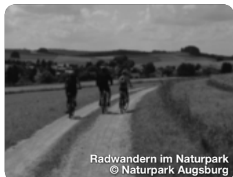
Radwandern im Naturpark

TreffpunktDeutschland.de/augsburger-land