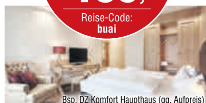
Bsp. DZ Komfort Haupthaus (gg. Aufpreis)