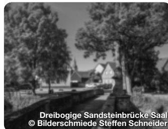
Dreibogige Sandsteinbrücke Saal