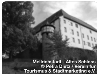
Mellichstadt - Altes Schloss

Der Landkreis Rhön-Grabfeld liegt im Herzen Deutschlands und ist bekannt für seine atemberaubende Natur. Die Region ist geprägt von Bergen, Tälern, Flüssen, Seen und Wäldern. Mehr als 50 % des UNESCO-Biosphärenreservats Rhön befinden sich im Landkreis Rhön-Grabfeld. Hier wird die Natur mit ihren vielen, teilweise selten gewordenen Tieren und Pflanzen geschützt und bewahrt. Gleichzeitig bietet die einmalige Natur- und Kulturlandschaft viele Bildungs- und Erlebnisangebote für Besucherinnen und Besucher. Ein Beispiel für Schutz, Erlebnis und Bildung zugleich ist das Schwarze Moor auf der Langend Rhön, welches zu den bedeutendsten Hochmooren Europas zählt. Mit solchen Besonderheiten und derzeit 243 Wandertouren ist die Region ein Paradies für Wanderbegeisterte. TreffpunktDeutschland.de/rhoen-grabfeld