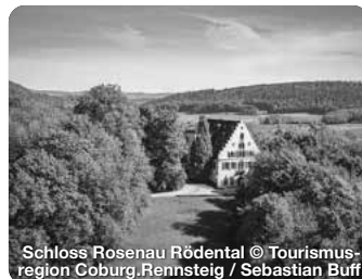
Schloss Rosenau Rödental