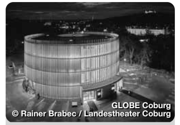
GLOBE Coburg