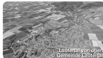
Lautertal von oben