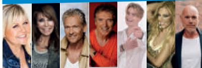
Gaby Baginsky, Ireen Sheer, Olaf Berger, Peter Orloff, Vincent Gross, Loona und Olaf Henning