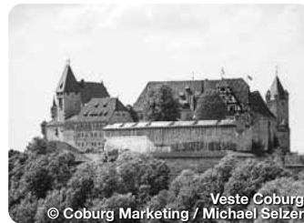
Veste Coburg