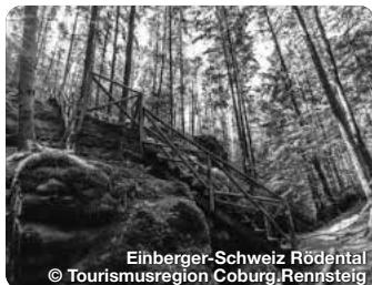
Einberger-Schweiz Rödental