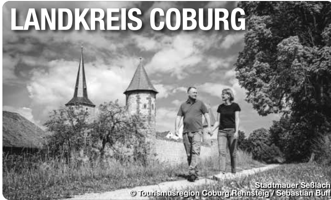
Stadtmauer Seßlach

Der Landkreis Coburg, idyllisch gelegen im Norden von Franken, bezaubert Besucher mit seiner reichen Geschichte, seiner malerischen Landschaft und seinem kulturellen Erbe. Hier können Besucher in die faszinierende royale Vergangenheit eintauchen, gut erhaltene Schlösser besuchen und durch historische Gassen in Mittelalterstädten wie Seßlach und Bad Rodach schlendern. Neben dem kulturellen Erbe lockt der Landkreis Coburg auch mit einer Vielzahl an Naturerlebnissen. Herrliche Wanderwege führen durch idyllische Wälder, entlang malerischer Flüsse und zu Aussichtspunkten, die einen unvergesslichen Blick über die Region bieten. Der nahegelegene Thüringer Wald lädt zudem zu ausgedehnten Spaziergängen und Erkundungstouren ein.