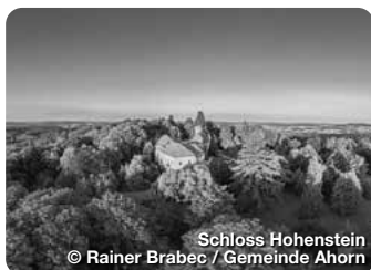
Schloss Hohenstein