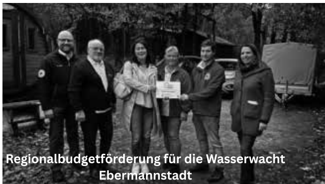
Regionalbudgetförderung für die Wasserwacht Ebermannstadt

Wie Sie mitmachen: Reichen Sie Ihre Idee bis zum 23. Januar 2026 bei uns ein – indem Sie das Formular auf www.ile-fsa.de ausfüllen und zusammen mit den Kostenberechnungen per Mail an uns schicken.